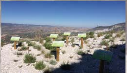
Área de reforestación Sibelco Europe